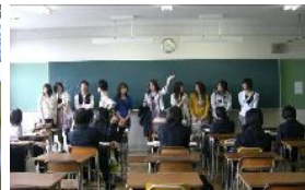
卒業した3期生で 連休中の補習中1～3年生 を応援に来てくれました それぞれ大学生活について 話をしてくれました